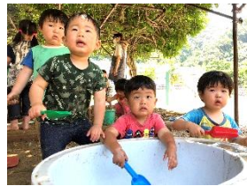
泥んこ遊び・水遊び・泡遊び 水が顔にかかるとちょっぴりビックリしちゃうけど・・・ 冷たくていい気持ち☆楽しいね～☆