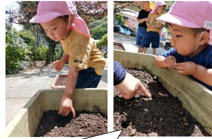
あさがおの種まきをしたよ！ 何色の花が咲くかなあ？