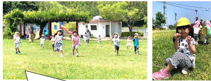
バス遠足 ターザンロープや遊具で遊んで、広場ではかけっこ したりお花をつんだり、とても楽しい遠足でした♪