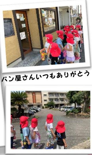
パン屋さんいつもありがとう!