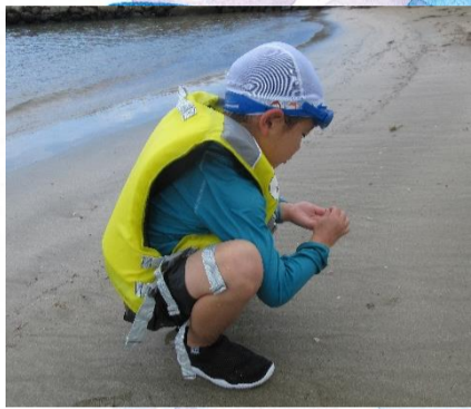
貝殻やカニを探したよ♪