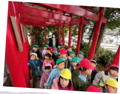
あぎとくんの家の 大根も持たせてもらったよ