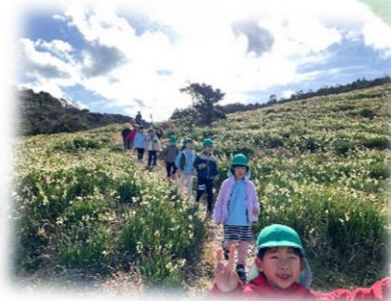
梅を見に行ったよ！ 益田川の土手