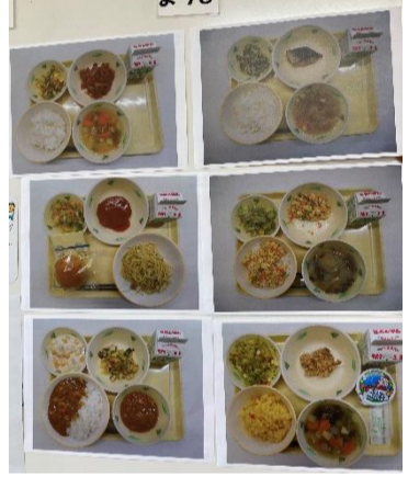
最近の給食はメニューが豊富☆ 基本はご飯ですが、時々パンの日もあります！季節でお楽しみのデザートが出ることも♡