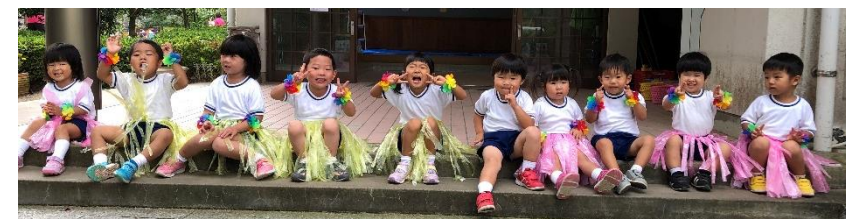
きいぐみさんは全体リレーにも参加！勝つと嬉しい、負けると悔しい、そういう気持ちが芽生えているのも成長です！！運動会を経験して「悔しいけれど次は勝つぞ！頑張るぞ！」という意欲、「勝ったお友だち、よかったね！」と思える気持ちも少しずつ育まれていきますね。