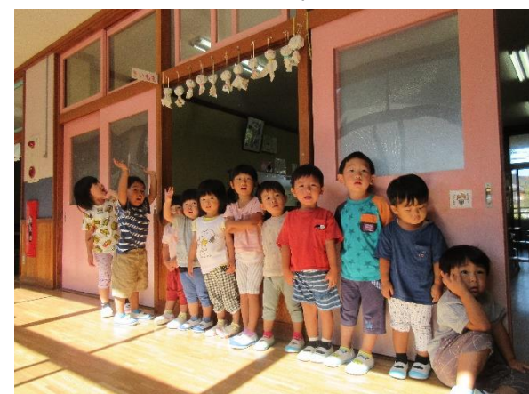
運動会前日にはみんなでてるてる坊主を作りました！あーした天気にしておくれ♪と大きな声で歌いましたよ☆